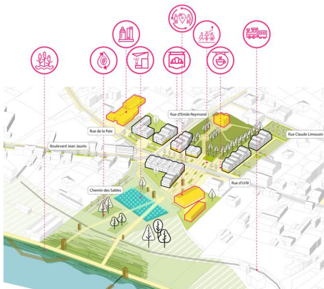
Projet : atelier Villes & Paysages

Pour cette mission, Améten assure l'analyse des enjeux et contraintes environnementales, y compris pollution des sols, traduction en terme de possibilités d'aménagement, Améten a également initié la concertation amont avec les services instructeurs